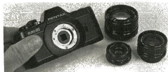
Den kombinerede lukker/blænde sidder i kameraet, lige bag objektivbajonetten.

diafilm, dels nogle splinternye med sorthvidfilm og 18x24 cm forstørrelser.