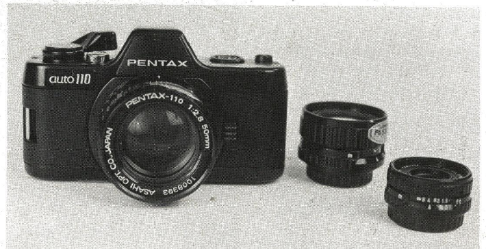
Pentax Auto 110 er et elektronisk kamera. Som tilbehør fås bl.a. tele og vidvinkel.

ringstiden forlænges. Ved 1/30 sekund er man nået til fuld blændeåbning (f:2,8), og herefter er det kun lukkertiden der forandres - indtil 1/1 sekund.