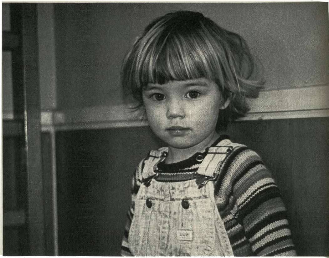
Så flot er billedkvaliteten, trods det lille pocket-format.

På det område har jeg dels nogle gamle erfaringer med